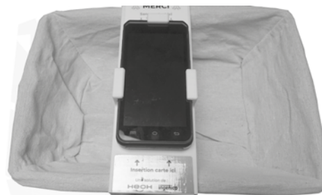
Un panier équipé du terminal de paiement.

EXTRAITS DU SITE DE LA CONFÉRENCES DES ÉVÊQUES, RUBRIQUE LITURGIE ET SACREMENTS.