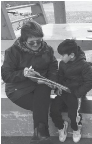
Lecture et dessin