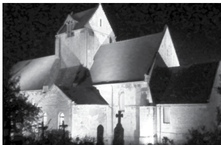
Vues de l'église Saint-Martin