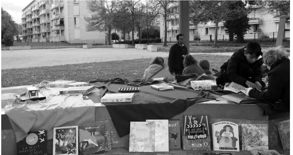
Place Sully, la bibliothèque de rue fonctionne toute l'année : au même endroit, le même jour de la semaine, à la même heure.