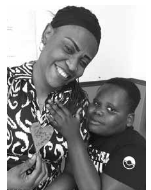
Un joli cœur pour la fête de sa maman