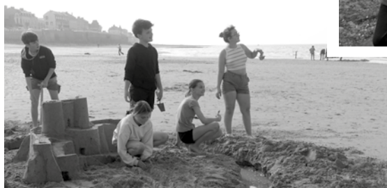
Dimanche vers 17h, nous marchons vers la plage, la marée basse nous a permis de faire des constructions de sable et la météo clémente de pique-niquer sur le sable.