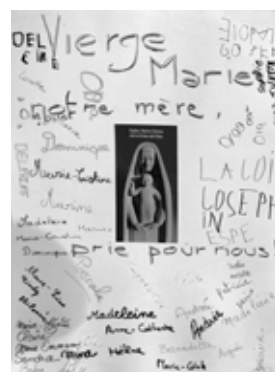
La prière à la vierge, les prénoms de chaque maman